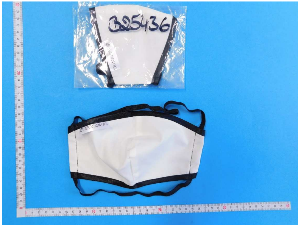
Abb. 1: Medical Face Mask Sonovia